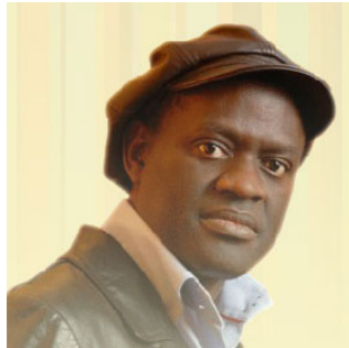
Président du jury Alain Mabanckou