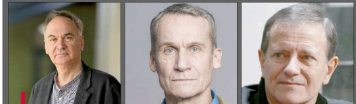
Hervé Le Tellier, Andreï Makine, Francis Huster. Ci-dessous: Etienne de Montety, Franck Bouysse et