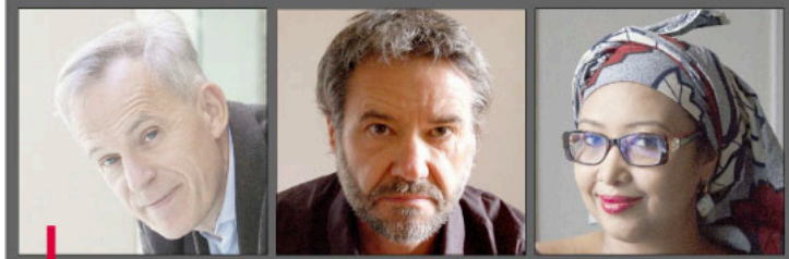
Djaili Amadou Amal